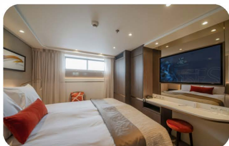
Standaard kajuit (14m 2 ) Benedendek met vast raam