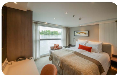
Luxe kajuit Frans balkon (16m 2 ) Midden- of bovendek